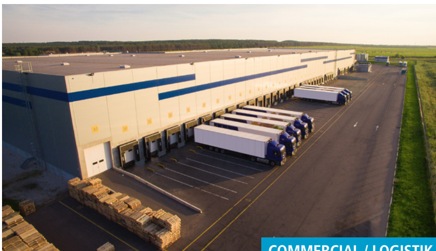
COMMERCIAL / LOGISTIK

Mit unserer jahrelangen Erfahrung empfehlen wir uns als kompetenten Partner, der Ihre Ansprüche an eine Immobilienverwaltung genau kennt und entsprechend erfüllen kann. Vom professionellen Reporting, das jederzeit Auskunft zum Status Quo gibt, bis hin zur fundierten Verwaltung von Objekten und der kundenorientierten Betreuung Ihrer Mieter stehen wir Ihnen zuverlässig zur Seite. Die kfh verfügt über ein ausgeprägtes Netzwerk zur Steigerung der Objektperformance wie z. B. bei Übernahme von Neubauprojekten oder Bestandsportfolios.